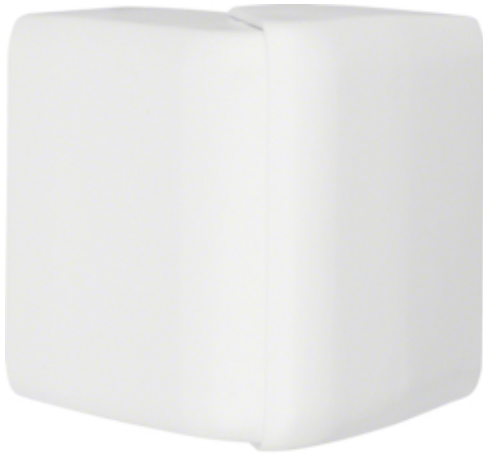
UTVENDIG HJØRNE, ATA20x50, PH