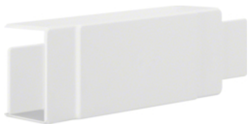
T-OG X-STYKKE, LF40060/61 PH