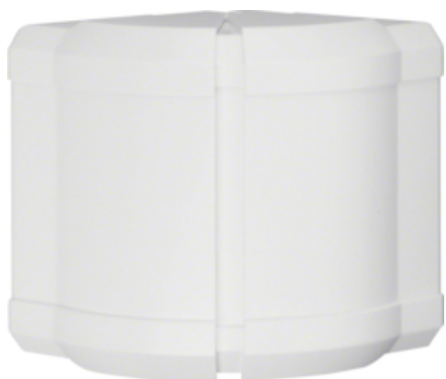
UTV. HJØRNE FOR BRN 70110, PH