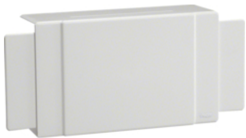
T-OG X STYKKE FOR LFH 60110 PH