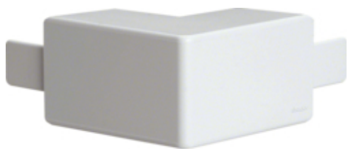
UTV. HJØRNE FOR LF40040 PH