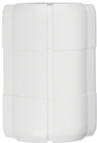
UTV. HJØRNE FOR BRN 70210, PH