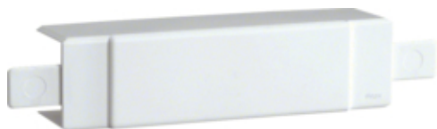
T-OG X-STYKKE FOR LF40040 PH