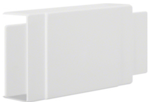
T-OG X-STYKKE, LF40090/91 PH